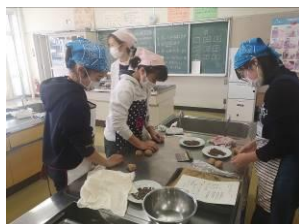
パンの香りがたまりません