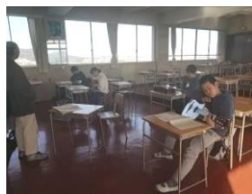
左から…百人一首、ギター、トランポリン