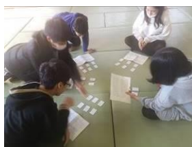
職員講座も開きました