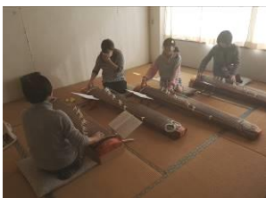
琴の音が響きました