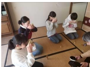
点てたお茶をいただきます

この講座は、保護者の方のご参加も大歓迎です。参加申し込みのご案内は、お子様を通じて毎回事前に配布しています。来年度のお越しをお待ちしています。ぜひお楽しみ下さい。