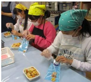
クッキーを丁寧に袋詰め