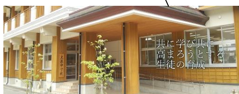
林業の町四万十町ならではの素敵な校舎です