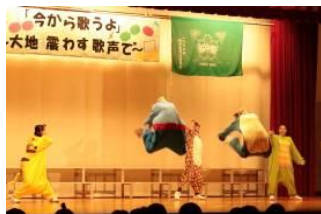
ゆかいな仲間たち