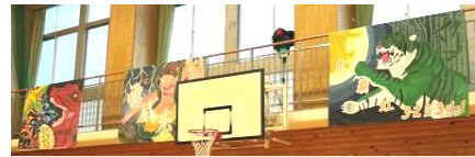
合唱を見守ったブロック旗