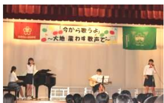
なんちゃって女バス concert