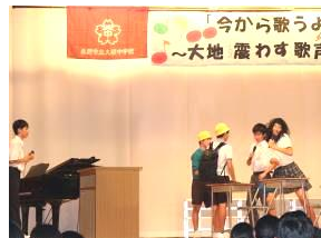
M 3 K 2