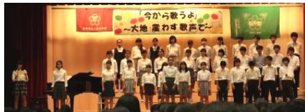
2-2 HEIWA の鐘