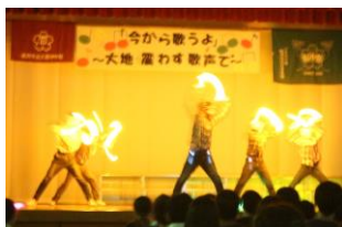
タカノ・カンターズ