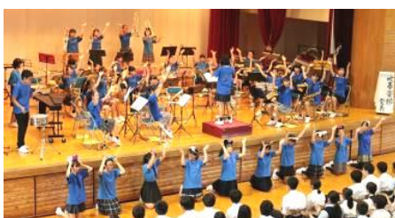
吹奏楽部の見事な演奏 ブロック長も1年のダンスも素敵でした

神輿とブロック旗は、どのブロックも素晴らしい出来栄え。美術部の作品も吹奏楽部の演奏も質の高い見事な発表でした。