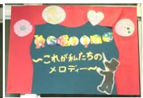
学年スローガン 左から、1年、3年、2年