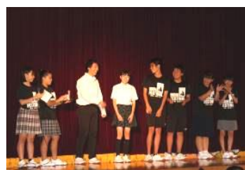
本部 & 放送委員