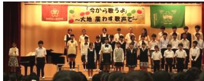
1-1 あの素晴らしい愛をもう一度