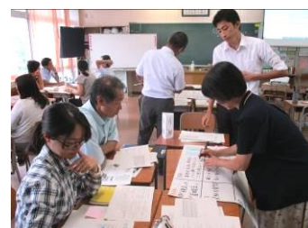
4人グループで発問について協議

今年度より教科化となった道徳の授業づくりと評価について、昨年度もお越しいただいた講師の方をお招きし、実際の教材を用いて中心発問と評価の在り方についての研修を実施しました。