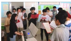
パートで集まり練習中

運動の部は毎月14日土曜日、文化の部は10月4日金曜日の開催です。また、文化の部当日はPTA砂田が丘祭も同時開催いたします。ぜひ、お時間のご都合をつけてお越しいただき、大中生の輝く姿をお楽しみ下さい。