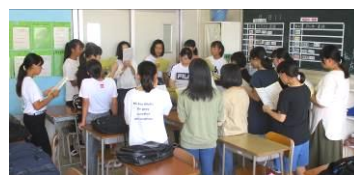
いい声 響きわたれ!