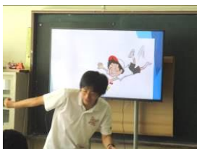
中学時代のリレー選手体験を熱演披露中