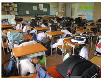
地震発生後 その場でシェイクアウト

大切な命を守るため、災害に対しては普段からの意識（計画）と物品の準備が大切。ご家庭内で様々な状況を想定してお話し合いを持ち、定期的に確認をしていって下さい。