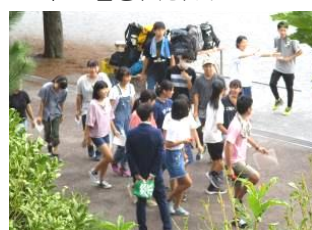
まずは行進練習の練習の練習から