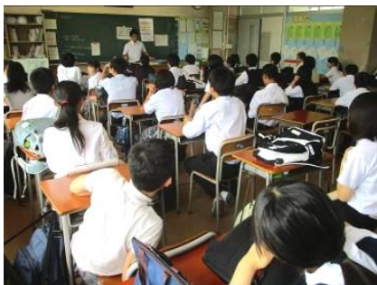
地震発生前 学級では先生が話中

で、③そして避難所へ」の順で市総合防災訓練が行われ、大根中では、備蓄倉庫の点検や災害時のWC・給水関係の設備点検、来校した自治会の受付と物品の引き渡しなどが、市地区配備隊の方々を中心に進められました。