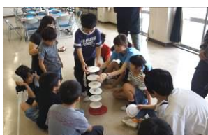
どこまで積み上がるかな?