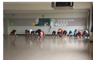
最後に掃除 ありがとう!