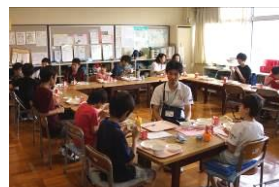
給食 いただきま〜す

6月28日は広畑小のひろはた級にお邪魔して、ゲームと給食の交流を行ってきました。また、7月5日の小中交流会では、ひろはた級と大根小のなかよし級の子達を中学にお招きしてゲームと会食を楽しみました。小学生をリードする姿はとても頼もしかったです。