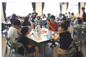
作ったおやつをどうぞ