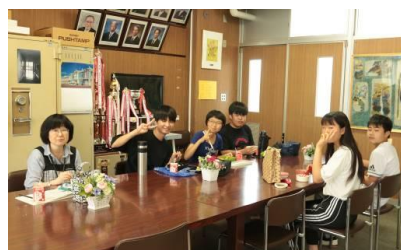
面談前は学年の先生と一緒に会食

5月7日から昼休みに行ってきたグループ面談が7月8日に終了しました。2学期は15分程度の個人面談。どんなことを語ってくれるか楽しみです。