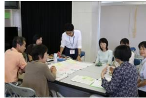
他の小中の先生方にも大勢ご参加頂き研究討議を進めました