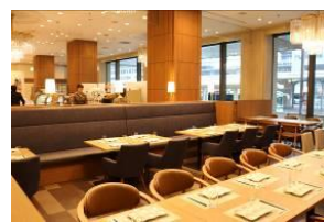
夕食待ちの静かな会場