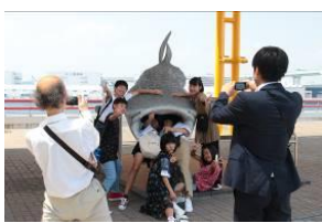
海遊館でジンバイザメと