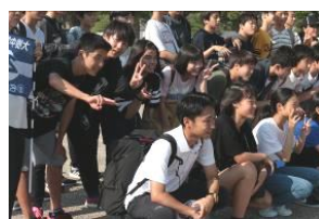
大阪城ではクラス写真