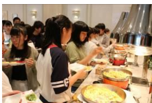
朝から食べられるかなあ