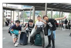
タクシーは京都駅で下車