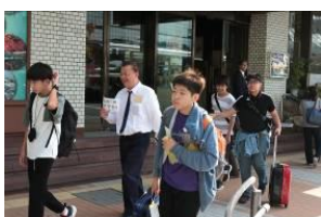
運転手さんと行ってきま～す