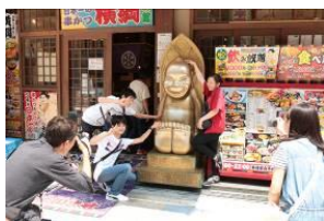
大阪はやっぱりピリケンさん