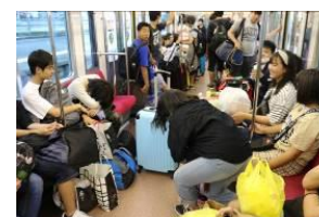
小田急車内 ケースが…