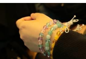
体験で作った念珠