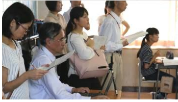
PCとカメラで授業の様子を記録

6月18日、道徳教育に造詣が深い福田鉄雄氏（実践女子大学勤務）を昨年度に引き続き講師としてお招きし、校内道徳研修会を実施しました。