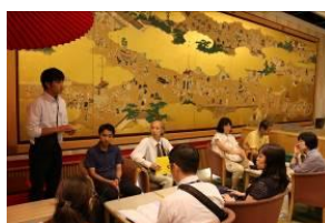
全班出発後の職員打合せ