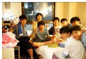
部屋での楽しいひと時