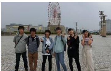
こちらは夢の大橋CPです