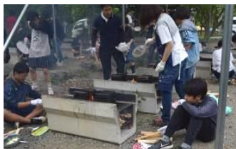
煙になんか負けないぞ