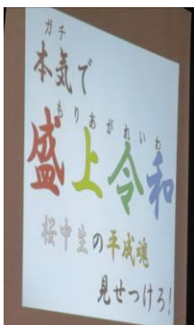
桜中祭スローガン