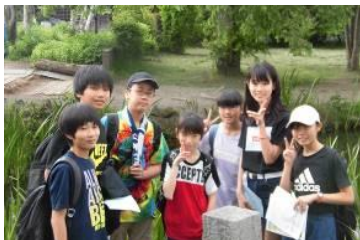
オリエンテーリングに挑戦