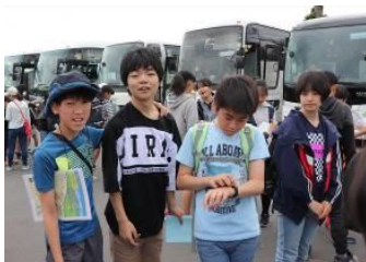
バスの中は満足！満足！