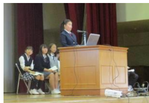
皆 工夫して話していました

冊子や画面、発表する言葉や壇上の雰囲気によく表れていて、今年度の確かな躍進を感じ取ることができました。