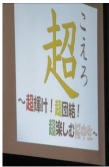
生徒会スローガン