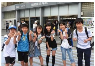
国際展示場駅前のCPに無事集合