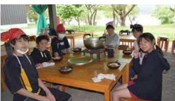
カレーライス いただきま〜す！