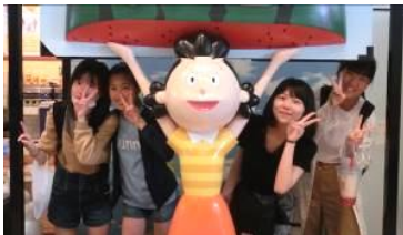
愉快的サザエさん一家♡