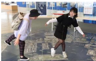
東京上空を通過中！