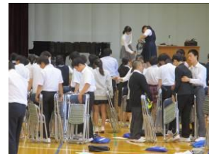
準備・片づけは3年でした