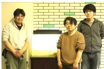
OFC会員の〇〇さん・〇〇さんと3人で設置していただきました