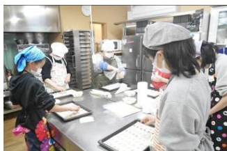
美味しくできますように

6日の水曜日に、今年度3回目のふれあい講座を実施しました。講師の皆様には、毎回お忙しい中お取り組みくださり感謝にたえません。ありがとうございました。