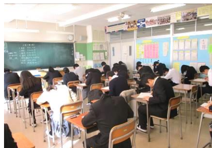
3年生 中学最後の定期テスト

さて、この3連休に県内の私立高校の一般入試が実施されます。予報では気温は低くなるとのこと。交通安全にも気をつけ、これまで蓄えた力を存分に発揮してくる充実の一日となることを願っています。 受験生の皆さん Fight!