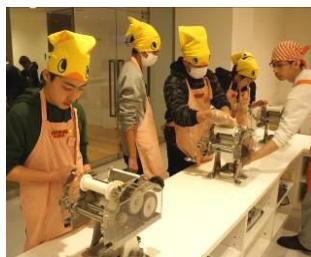
こねたら細い麺にして...