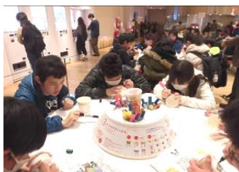
自分だけのオリジナルカップ