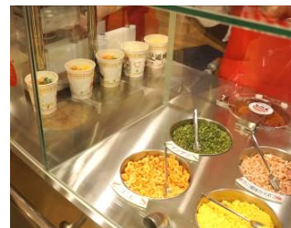
あとは何を入れようかな