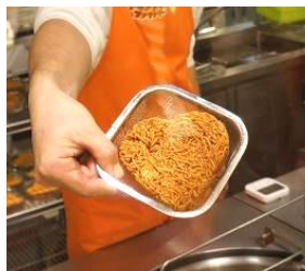
揚がった麺は美味しそ〜