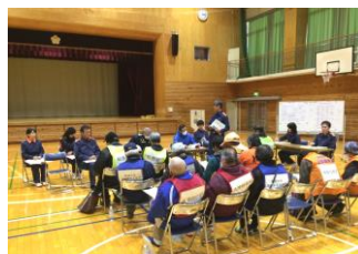
自治会代表の皆さんで打合せ

毎年行われているこの訓練では、被災後に避難所を開設するまでの手順と開設後の運営についての検討を進めています。詳しくは、各自治会の中でご確認ください。