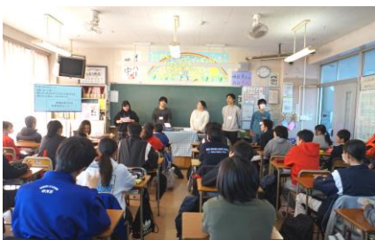
最初はお互いにちょっと緊張気味？