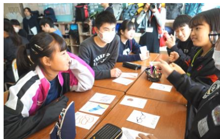
どの品物を使うのかなあ…