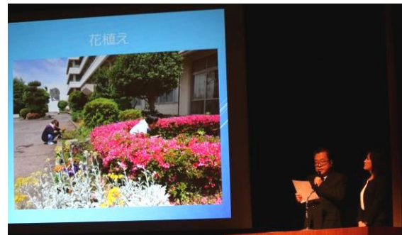
環境委員の花植えの様子を紹介 砂田が丘祭も含め、各委員会の活動を伝えました

この通信はカラー版で市HPにアップしてあります。「大根中学校」を検索して、「砂田が丘通信」からご覧ください。