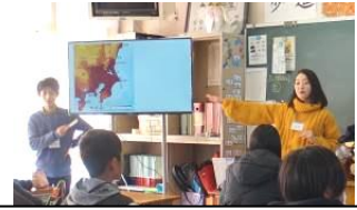
ESD・・・持続可能な開発のための教育

東海大学「熊本復興支援プロジェクト」で学んでいる大学生と、ESD塾で学習支援を行っている大学生14名が、2年生の各クラスで地震防災に関する授業を行いました。