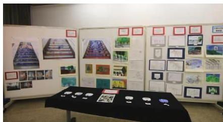
美術部の活動で生まれた作品の数々