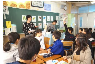
使う品物のカードを上げて答え合わせ