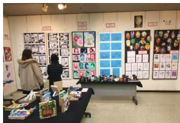
各学年の選りすぐりの作品

19・20日に、市文化会館で中学生の美術展が行われ、大根中学校からも多くの作品が並びました。