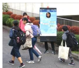
歩きスマホはナシだよ！