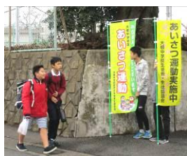
返してくれて気持ちいいな