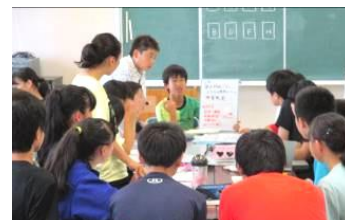
2年 これからこうすれば…

集まって今後の取組みについて話し合いました。生徒が動かす学校生活。とても楽しみです。