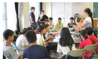
1年 学年をどうしているのか