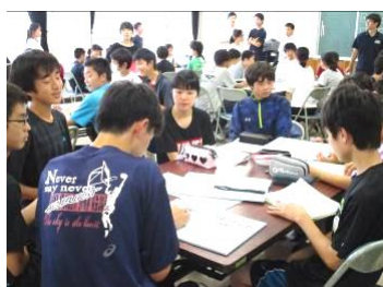
3学年混ざってのグループ協議 3年のリードはさすがでした！

より良い学年をつかっていくためには…。7月6日の放課後、今年度1回目の拡大学年委員会が行われました。