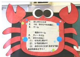
楽しい楽しいプログラム

7月6日に、大根小のなかよし級と広畑小のひろはた級の子たちが来校し、特別支援級恒例となる小中交流会を行いました。