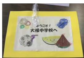
手作りでおもてなし