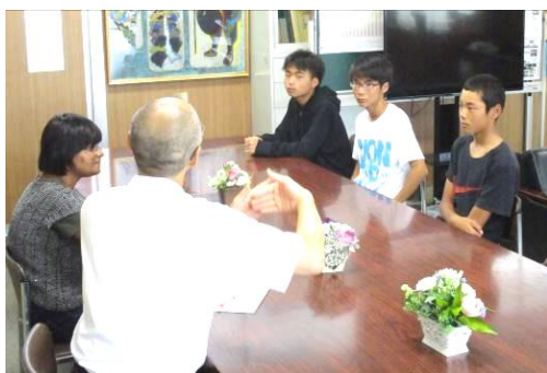
3年生のみなさん ありがとうございます

今年の3年生は5クラスで例年よりも人数が多いですが、1学期のうちにグループ面接を進めることができました。都合でできなかった人は2学期の面談で、ぜひいろいろな話を聞かせてくださいね。