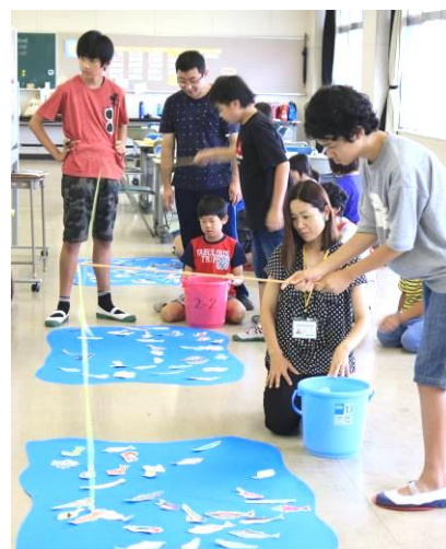
中学生はさすがに上手！

小学生との交流は中学生の励みになります。準備はもちろんですが、当日の全体リードやグループの小学生に一生懸命声をかけていく姿は立派で頼もしく、入学してからの三ヶ月での中学生らしさへの成長を嬉しく感じました。