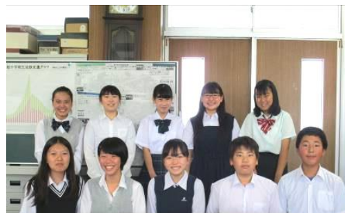
6月22日 校内事前研修会にて

また、研修生側からスタッフ側の立場が変わるこのボランティア経験が、10人の大事な経験と成長につながることを願っています。