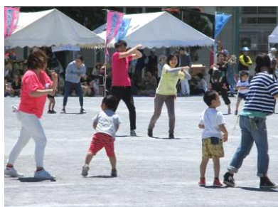
ひろはたこども園・つるまきこども園 大根幼稚園の子たちが親子でダンス