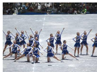
秦野高校のチアリーディング部 VIGORS（ピガーズ）の見事な演技