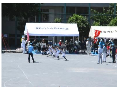
小学生が全力疾走！ 小さな子たちが大勢参加しました