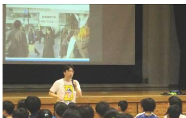
交差点で個人情報を見せているのと 同じことが起きているのです