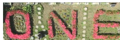
1棟前花壇の「ONE」がお出迎え