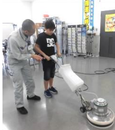
ポリッシャーに挑戦