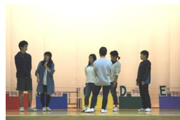
練習を嫌がる2人にどう声かけを…

集会の中で起きる自然の拍手も、気持ちよい雰囲気を作り出してくれています。仲間が仲間を支えていく。そういう風土が育ち広がっている大根中がさらによい学校になっていきますように。