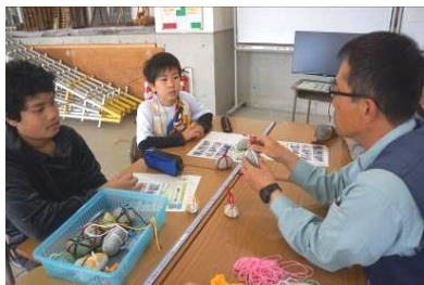
ペーパーウェイトを作りましょう