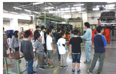
自動車整備の設備を見学中

昨秋に2年生の職場体験を受け入れて頂いた「かなテクカレッジ西部」へ、あすなろ級が4月27日（金）に春の校外学習でお邪魔しました。本格的な設備の見学と実習はちょっとした緊張とともに、とても楽しめたことと思います。