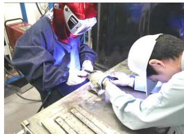
溶接したらソーブディッシュが完成