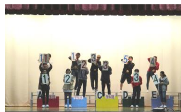
全校へ発表 あれ？1つ不思議が

お子様は何ブロックになったかご存知ですか？ まだの方は、ぜひ尋ねてみてください。