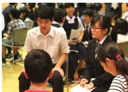
5月6日 大根小・広畑小の子たちと

今年で11回目となるこの取り組みは、市内全小中学校の代表2名ずつが集まり、年4回の会合の中で、いじめ防止に向けての意見交換を行い、それをもとに各校での取り組みを行っていきます。