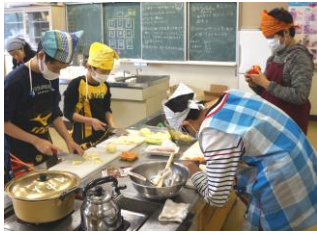
包丁の使い方はGOODです