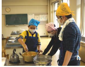
しっかり煮込んでいい匂い

18日(水)にあすなる級で調理実習を行いました。4グループに分かれて挑戦して出来あがったカレーには、それぞれの子の努力の味がしみ込んでいたことと思います。