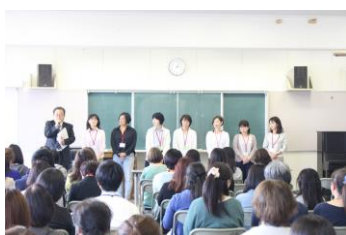
今年度の本部役員さんの紹介

もうすぐGWが始まります。薫風さわやかな日々になるとよいですね。ご家族皆さま、お体に気をつけてお過ごしください。