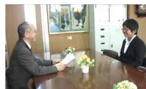
描いている自分の将来は…？

多くの子たちはこれから受験。受験は他の受験生との勝負だけれど、実は『自分との戦い』です。健康管理や気持ちの持ち方など様々なハードルを乗り越えながら、日々自分の道を切り拓いていく。クラスメートや友達と励まし合って進んでほしいです。ガンバッテ！