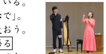
講演会后、希望者に触らせて下さいました