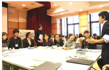
司会を担当 ピアサポートの説明もしました