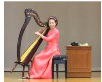
進行はすべて自分たちで

アイリッシュハーブの紹介や演奏曲の背景を教えてくださいながら、大切に生きていくことを、ユーモアを交え温かく語っていただきました。