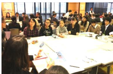
PTAの方の話も聞きながら