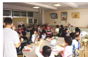
雨の多かった10月でしたが、この日は晴天に恵まれました。