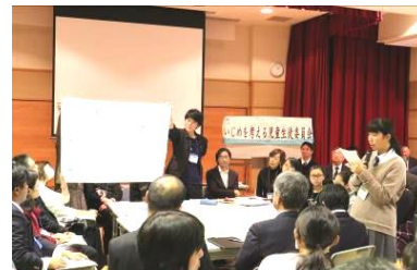
最後に中学校区のまとめを全体へ発表