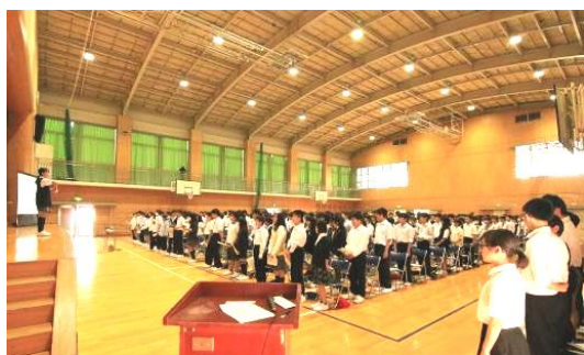
議事に入る前に生徒会歌を斉唱しました