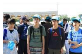
こちらの4人は審判員