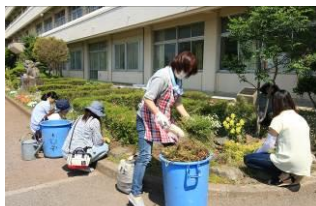
まずは草むしりから

23日に、PTA環境整備委員さん本部役員さんとボランティアの皆さんで、1棟校舎前の花壇をきれいにしていただきました。