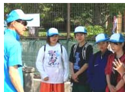
放送係と準備係へ

21日におおね公園スポーツ広場で行われた第62回市民体育祭大根鶴巻地区大会で8人がボランティア活動をしました。今年は鶴巻中学校が中間テスト前で2名のみでの参加だったので8人は大戦力になったと思います。参加してくれた皆さん、お疲れ様でした。