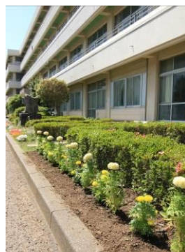
23日は夏日でした 暑い中ありがとうございました