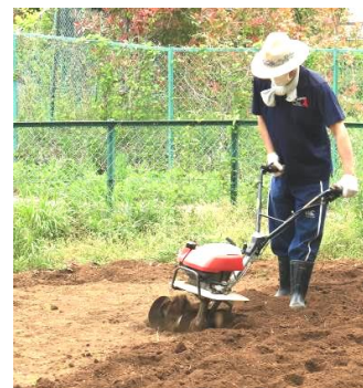
今月下旬に植え付けをします。水やりと除草をして、10月に収穫です。