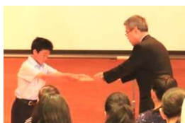
内田教育長さんから委嘱状をいただきました