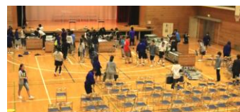
片付けは1年2組と役員さん達 (準備は1年1組でした)