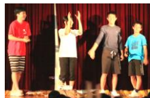
桜中祭実行委員さん