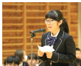
在校生代表の言葉