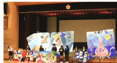
各部からの活動の紹介