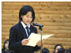
新入生代表の言葉