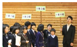
入場が完了しました

9日(月)に、全校が体育館に集まり、本部役員のみならずリードして対面式を、その後委員会や部の代表がリードして新入生オリエンテーションを行いました。1年生には、上級生の姿がどのように映ったのでしょうか？