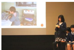
委員長による委員会の活動の説明