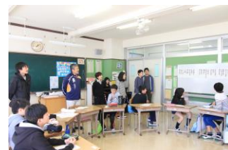
上級生と先生で校歌を披露