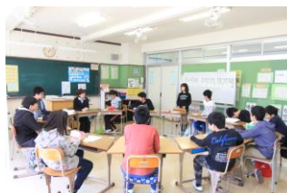
一人ひとり自己紹介しました