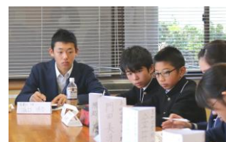
委員会の連携・常時活動の活性化 ～記録と全体会での発表役も～