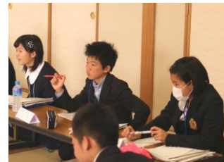
いじめ対策や諸問題解決への取り組み

参加した皆さん、お疲れ様でした。3学期、そして来年度の活躍と大根中学校生徒会活動の発展を期待しています。