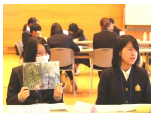
独自の活動・自慢の活動