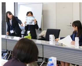
ボランティア・地域交流