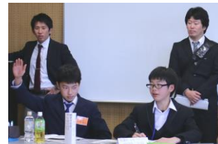
校則改正や諸問題への取り組み ～司会を務めました～