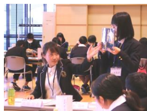
生徒会が取り組む学校行事・学校祭