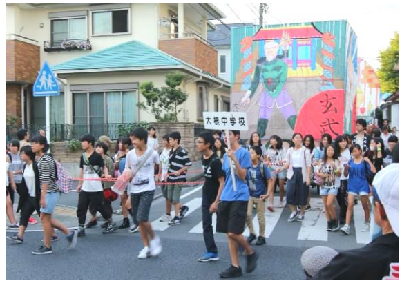
いざ出発！これから街中に向かいます

四面を飾った作品はそれぞれのサイズが大きく、桜中祭の準備と並行して、夏休み中に一生懸命作り続けてきた大作でした。