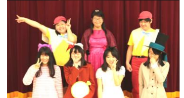
20日 演劇部 春の自主公演 「不思議の国のアリス」