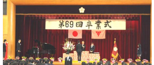
14日 第69回 卒業式