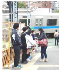
9日 鶴巻温泉駅 市内中学校3、11合同募金