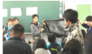
16日 大根小学校5年生と2年生 ピアサポート