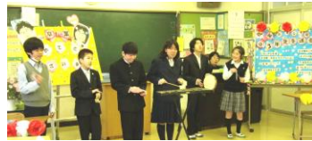
7日 あすなろ級 3年生を送る会