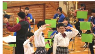
20日 吹奏楽部 定期演奏会 Spring concert