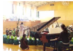
4日 大根幼稚園年長さんと3年生 歌の交流会