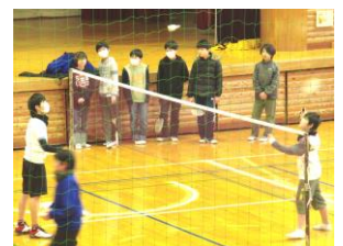
簡単そうで実は難しい