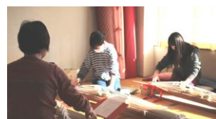
指使いから丁寧に