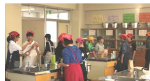
パンをほおぼり大満足