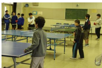
ラリーが続くかな