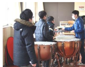
音が出ると楽しいね