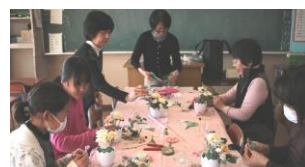
どんな花ができるかな