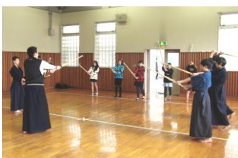
竹刀を持って素振りの形

新入生の子たちが、夢を持ち、安心して中学校に入学してくれとよいですね。小6のご家庭がご近所にいらっしゃいましたら、ぜひ、大根中のPRをお願いいたします。