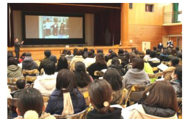
1/29 スライドで年間の様子を紹介