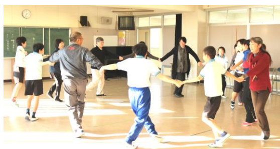
前日リハーサルでは先生方と一緒にダンス