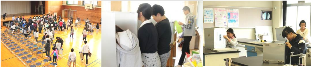
【左から】 会場片付けをしてくれた3年学年委員+有志一同 選挙管理委員の指示で1年生も初めての投票 放課後の開票作業