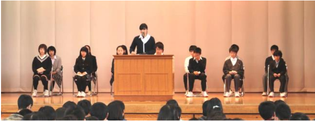
選挙管理委員長の言葉 全校が見事に一つになっての会でした

来年度の本部役員を決める立会演説会・選挙・開票作業が行われました。立会演説会では、候補者と推薦者が自分の思いを立派に語っていました。