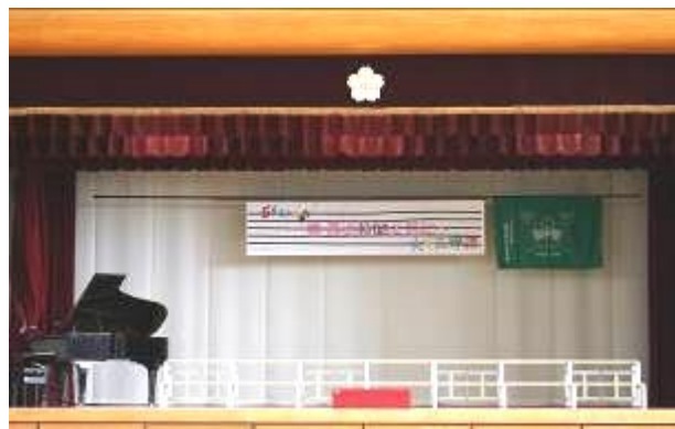
全校生徒を待っている早朝のステージ

桜中祭が、お子様たちの『自立と共生』の資質を身に付けていく一助となっていくことを信じ、願ってやみません。