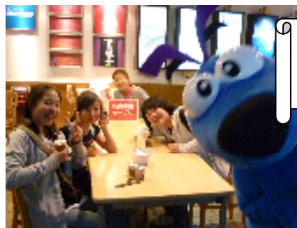
キャラクターの 着ぐるみとポーズ