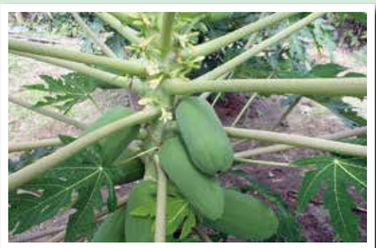
▲収穫前の青パパイヤ

はだの都市農業支援センターでは、新たな特産農産物の候補として露地栽培で青パパイヤの試験栽培を開始します。青パパイヤは一般的にフルーツとして食べられている黄色のパパイヤと違い、色づく前の青い未熟果を、野菜用として収穫します。脂質、糖質やたんぱく質を分解する酵素が含まれており、機能性の高さからメデイカルフルーツと