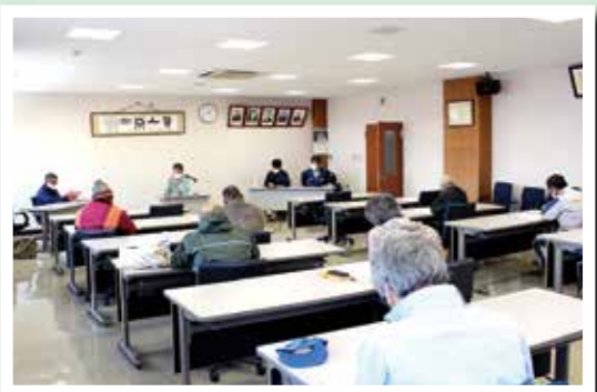
▲第1回栽培講習会の様子