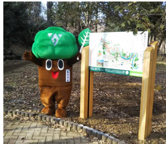
新しくセラピーロードの看板が設置されました♪

「森林セラピー」とは、こころと身体健康維持・増進、病気の予防の効果が、科学的な証拠に裏付けされた森林浴のことです。今年3月に森林セラピーソサエティによる生理・心理実験を実施した結果、秦野市全域が「はだの表丹沢森林セラピー基地」として、さらに、秦野市の魅力を最大限に体感できる5つの「森林セラピーロード」が認定されました。葛葉緑地も「くずは峡谷コース」として認定されています。