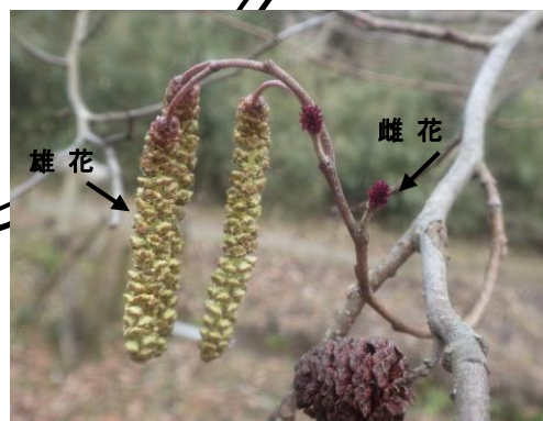
ヤマハンノキ 雄花 雌花 前年の実