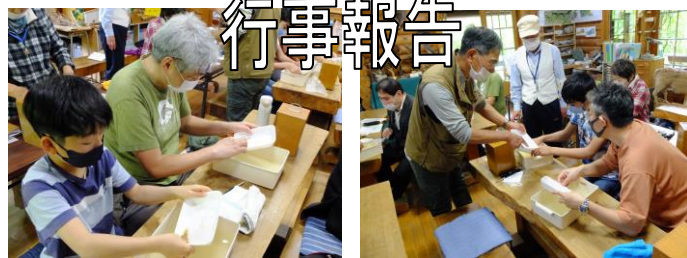
4/23 富士・箱根・桜島の火山灰をくらべよう!(10人)