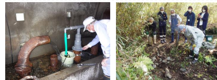
4/28 通水の様子(左)ポンプを始動させる様子(右)水が出る瞬間を固唾を飲んで見守る関係者の皆さん