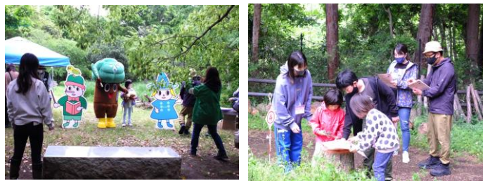
4/29 春のグレートンオリエンテーリング (183人)