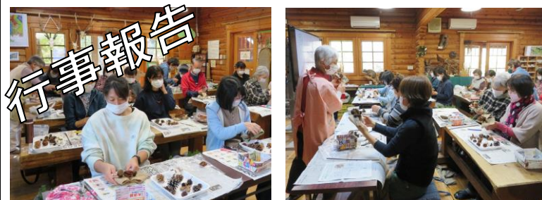
11/26 自然素材のクリスマスリース作り (32人)

定例会: 12/16(木)、1/20(木)、2/6(日) 花壇の会: 1/6(木)、2/3(木) とんぼのせせらぎ: 12/23(木)、1/27(木)