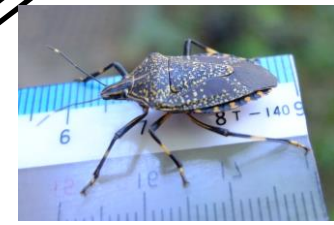
キマダラカメムシ