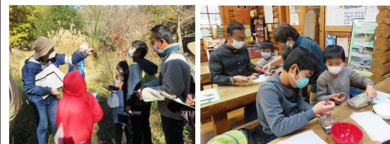
11/27 植物のふしぎ発見！～根っこってなんだ？～(7人)