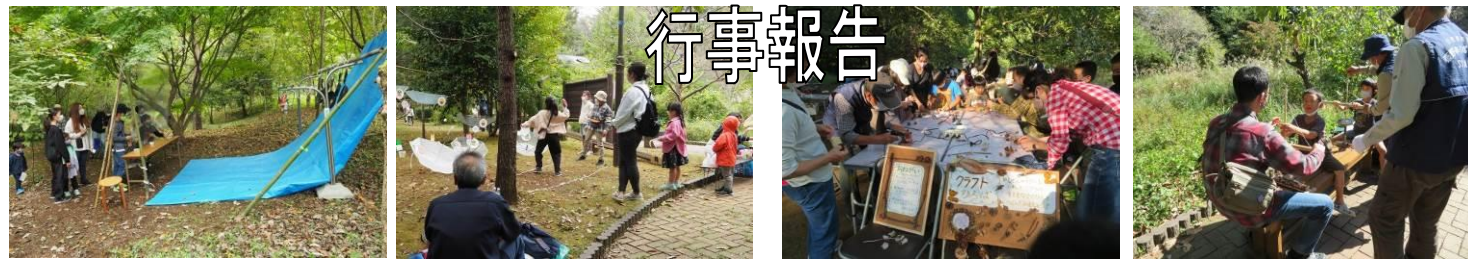
10/22(土)秋のつどい みんなで遊ぼう!(156人) 10/23(日)秋のつどい みんなで作ろう!(315人)

今年は3年ぶりの秋のつどいが開催できました! 22日は、クルミ投げゲーム、どんぐりパチンコなど盛りだくさんの遊びで、たくさんの歓声がかずはの広場に響き渡りました。23日は、クラフト広場や工作、火おこし体験など。子どもも大人も夢中になって工作している姿が印象的でした。