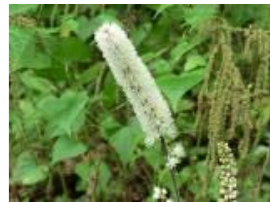
サラシナショウマ

シカ除けネットをかいくぐり、どんぐり山に大きなイノシシがやって来ました。コケの上にくっきりと足跡を残し、慌てて何度か滑りながら通りすぎて行った様子が伺えます。夜の広場は獣たちの世界？