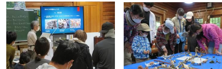
きのこウォッチング～身近なきのこ入門 10/9(21人)