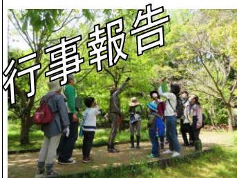
4/24 植物のふしぎ発見! ~春の味く草花~(21人)