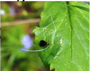
クロハネシロヒゲナガ

クロハネシロヒゲナガ…4月21日 どんぐり山の観察路で小さなクロハネシロヒゲナガがひらひら飛んでいます。体に似合わず長いひげ(触角)は半分だけ白く目立ちます。これでも蛾なのですよ！