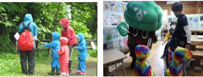
4/29 春のスペシャルグリーンオリエンテーリング(83人)