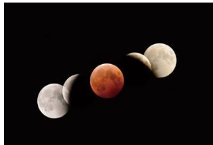
月に映る地球の影