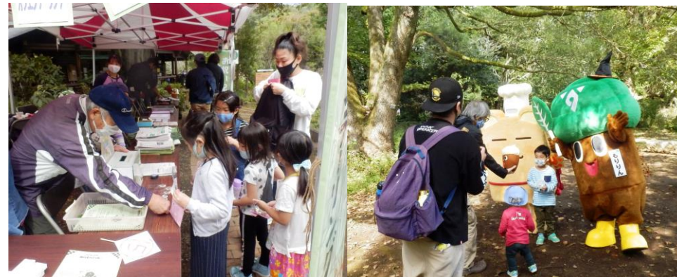
10/24, 25 秋のスペシャル☆グリーンオリエンテーリング (554人)