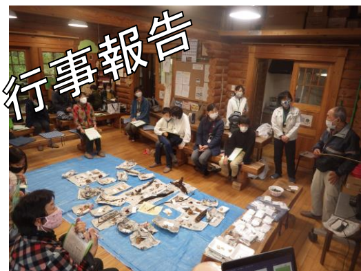
10/17 きこのこの観察会 (17人)