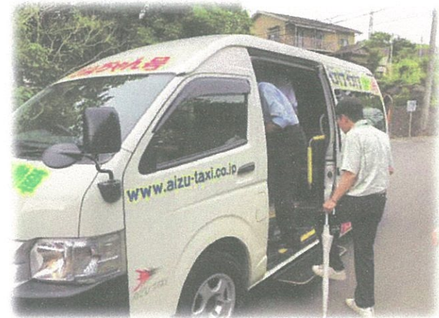
市役所の職員も乗車しました！

なお、今後は、以前のアンケート結果に基づく利用がされているか集計し、協議会で1年後を目途に見直しの検討も行います。