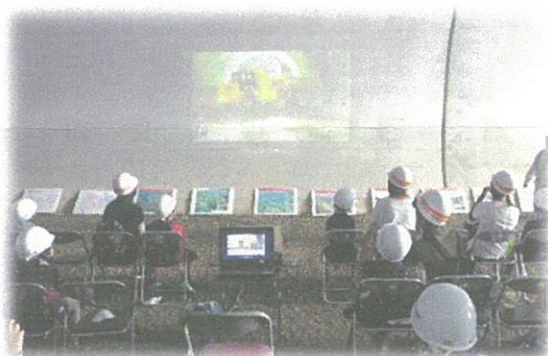
新しく出来たトンネルの中で作業風景をみんなでお勉強