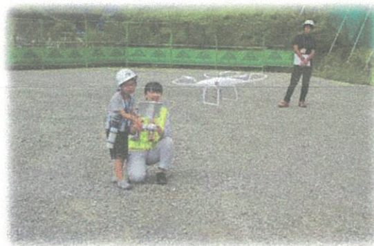
ドローン飛行の体験もさせていただきました。ドローンから見える秦野の景色もすごかったです。