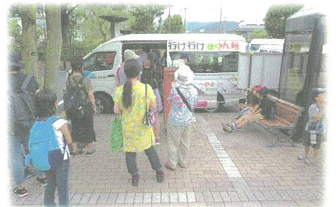
かみちゃん号に乗って出発 夏休みは子ども料金50円だからお得だね

今後も、かみちゃん号の利用促進のために、協議会でも検討を進めてまいりますので、みなさんもぜひ、かみちゃん号を乗り支えてください。