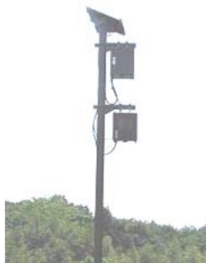
● 実際の監視システム