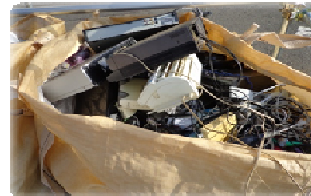
《回収した使用済小型家電》