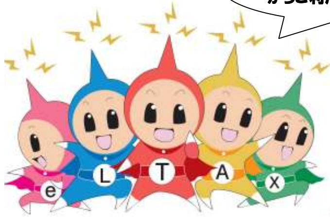
イメージキャラクター エルレンジャー