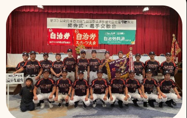
野球部、令和6年に県代表として 全国大会に出場