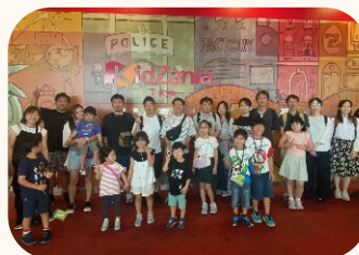
秦和会事業 「バスツアー キッサニア東京」

A 互助会である「秦和会」では職員やその家族で楽しむバス旅行や文化教室などを実施しています。また、野球、陸上、テニス、オフロードバイク、バレー、サッカーなどさまざまなクラブ活動があり、活発に職員同士の交流が行われています。