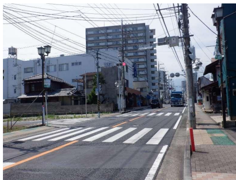
交差点工区 (片町通り交差点)