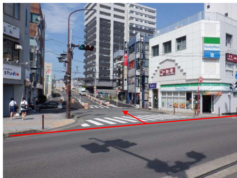
商店街工区 (本町一丁目交差点)