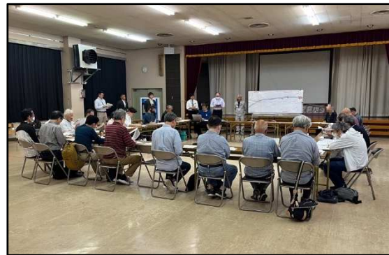
沿線地区への説明の様子