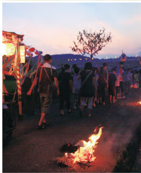
炎でともされたあぜ道(下大槻百八炬火)