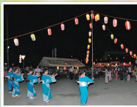
楽しくつくる踊りの輪(瓜生野盆踊り)

精霊を迎え入れ、祈りをささげるために代々行われてきた盆の伝統行事。昔の人々の思いに心を寄せてみませんか。