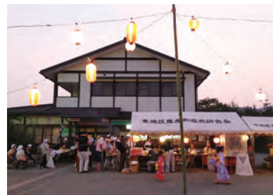
多くの人でにぎわう

時 8月13日(土) 午後5時～9時 ※雨天のときは14日(日) 内 祭太鼓、盆踊り、模擬店、綿菓子の無料配布など 問 農産課 ☎(82)9626