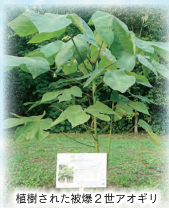
植樹された被爆2世アオギリ

広島での経験を胸に、昨年からチャイパークで行われた被爆2世のアオギリとクスノキの植樹に親子で参加した。今年もピースキャンドルナイトの実行委員も務める。