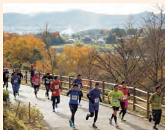
戸川公園を走る参加者