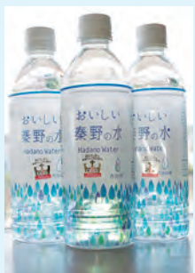
全国一位となった「おいしい秦野の水・丹沢の雫」

災害時のために備えを 1日1人当たり3ℓを最低3日分用意しましょう。市では、ペットボトル飲料水「おいしい秦野の水・丹沢の雫」をコンビニなど(市ホームページに掲載)で販売しています。