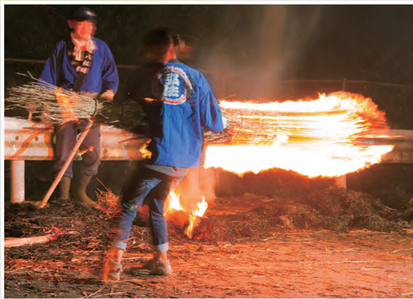
迫力の振り回し(瓜生野百八松明)

精霊を迎え入れ、祈りをささげるために代々行われてきた盆の伝統行事。昔の人々の思いに心を寄せてみませんか。