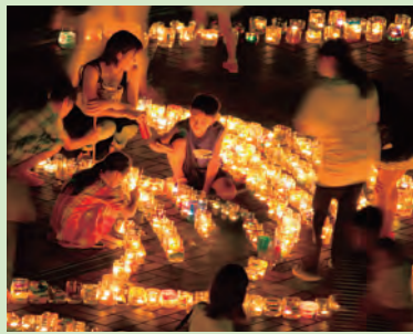
平和の祈りを込めて

とき 8月13日(出) 午後5時半～8時半 ※雨天のときは14日(日) ところ 文化会館 内容 ▽ピースキャンドル平和行進(午後5時半平和祈念公園) 6時文化会館) ▽ピースキャンドル点灯式(午後6時) ※サテライト会場の鶴巻温泉弘法の里湯でも点灯します