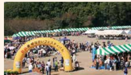
多くの人でにぎわう

模擬店、フリーマーケット、エア遊具、ゲーム、ダンスなど、子供から大人まで一日楽しめます。 とき 10月18日(日) 午前9時半～午後3時半 ※雨天中止 ところ 中井中央公園(中井町比奈窪580)