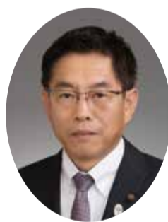
川口 薫 議長