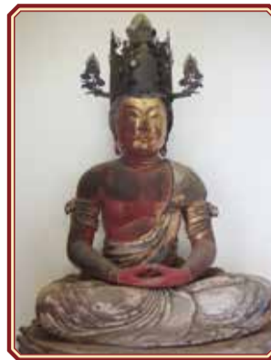
木造大日如来坐像(宝泉院)

文化財保護強調週間に合わせて、普段は見ることができない市の文化財を公開します。 とき 10月31日(土)～11月3日(火) 午前10時～午後3時(桜土手古墳展示館は午前9時～午後5時(入館は午後4時半まで))