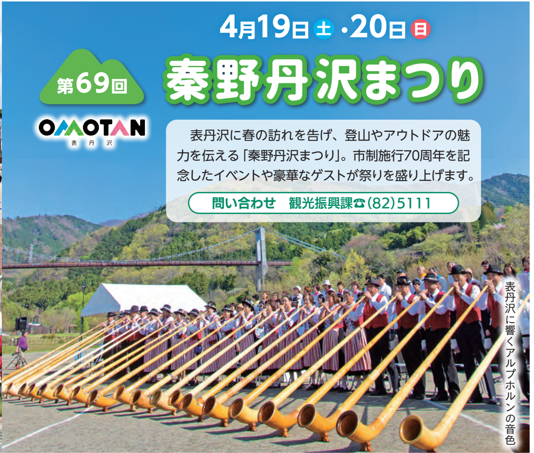
表丹沢に響くアルプホルンの音色