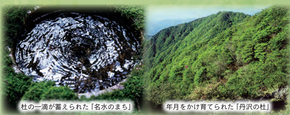
杜の一滴が蓄えられた「名水のまち」