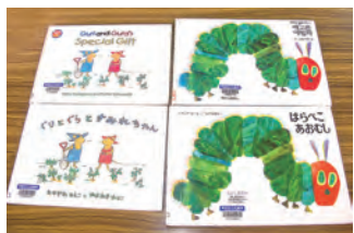
文字の違いだけじゃない