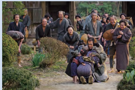
勤勉な少年が偉大な農政家に