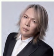
LUNA SEA 真矢

音楽隊や御輿が町を練り歩くほか、はだのふるさと大使のLUNA SEA 真矢さんが山車に乗り、和太鼓やしの笛で祭りばやしを奏でます。