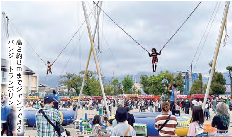
高さ約8mまでジャンプできるバンジートランポリン