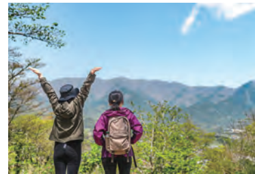
季節ごとで違った魅力も

スマートフォンアプリ「ヤマスタ」を使ってチェックインポイントを巡り、デジタルスタンプを集めると、記念缶バッジや認定証がもらえます。さらに、コース達成ごとに特製手拭いまたはピンズの抽選に応募できます。