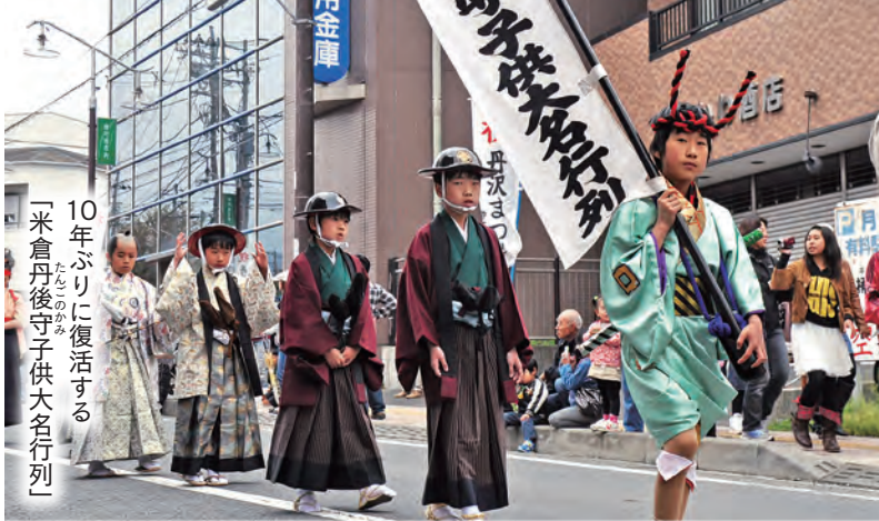
10年ぶりに復活する「米倉丹後守子供大名行列」