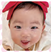
みやうちな 宮内新菜ちゃん (6・1・5生 平沢)