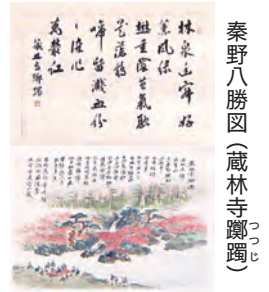
秦野八勝図(蔵林寺躰躰)