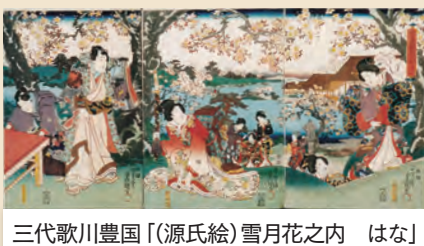
三代歌川豊国「(源氏絵)雪月花之内 はな」

花の名所が行楽地として栄え、品種改良が進み庶民たちも鉢植えを楽しむなど、園芸文化が大きく発展した江戸時代。人々が愛でた草木花の浮世絵43点を展示します。 とき 3月22日(土)～5月6日(火) 午前9時～午後7時(火曜日、祝日は午後5時まで)