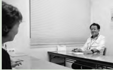
相談員が親身に対応

会場は、 市 =市役所 保 =保健福祉センター 農 =秦野駅前農協ビル3階 ば =市地域生活支援センターぱれっと・はだの(本町2-7-25)。各相談とも、祝・休日はお休みします。