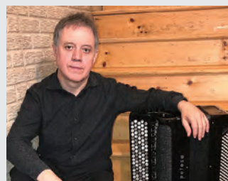
スタス・ヴェングレブスキー (アコーディオン)