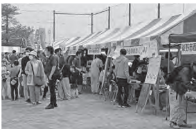
数多くのテントが並ぶ

とき・ところ ◇県立秦野戸川公園会場 4月19日(土) 20日(日) 午前10時～午後4時 ◇西中学校会場 4月20日 午前11時～午後6時半