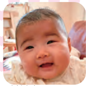
やまもとかの 山本一乃ちゃん (3・10・12生 尾尻)