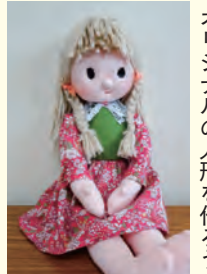
オリジナルの人形を作ろう

とき 7月31日(日) 午前9時～正午 対象 小学5・6年生5人(抽選) 費用 390円 申し込み 7月28日(木)までに電話または氏名、電話番号、学校名、学年を書きメール(h-kodomo@city.hadano.kanagawa.jp)