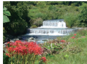
秋の訪れを感じよう

とき・ところ 9月16日(金)午前9時 沢駅改札前集合～田頭橋～浄徳院～上公民館～柳川不動堂～上秦野神社～午後3時 ※雨天中止 定員 30人(申し込み先着順) 費用 500円 申し込み 7月16日(土)～9月13日(火)