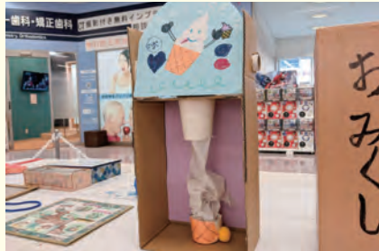
アイデア作品を応募しよう

優秀作品は、9月24日(土)・25日(日)にかなテックレッジ西部で展示されます。