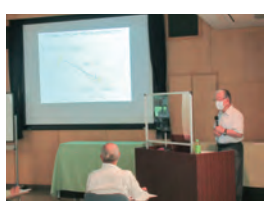
モニターを使い丁寧に解説