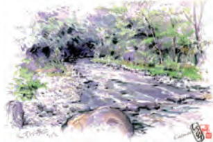
動きのある絵に挑戦

とき・ところ 7月21日(木)午前9時 秦野駅改札前集合～くずはの家～葛葉峡谷～午後3時 定員 20人(申し込み先着順) 費用 3000円