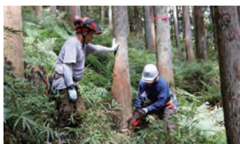
機材の使い方を学ぶ

とき 8月20日(土)～令和5年2月の土・日曜日、祝日の月1回程度 全5回 ところ 里山ふれあいセンター、市内の里山 定員 12人(申し込み先着順) 費用 2000円 申し込み 電話または住所、氏名、電話番号を書きメール (shinrin-f@city.hadano.kanagawa.jp)