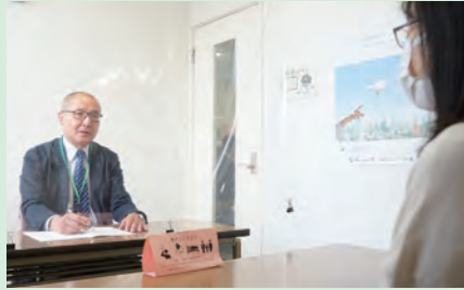
相談員が親身に対応

会場は、 市 =市役所 保 =保健福祉センター 農 =秦野駅前農協ビル3階 ば =市地域生活支援センターぱれっと・はだの(本町2-7-25)。各相談とも、祝・休日はお休みします。