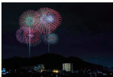
夜空に咲く大輪の花

0577349 金箱の設置場所 市役所などの市内公共施設、JAはだの本支所、市内の金融機関、コンビニ・スーパーなど 振込先 秦野たばこ祭実行委員会(花火募金) ▼ 中栄信用金庫本店 普通