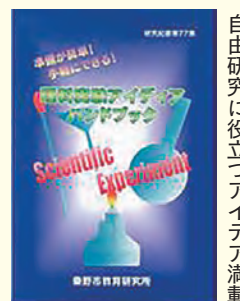
自由研究に役立つアイデア満載

内容 ペットボトルやごみ袋など、身近な材料を使った実験を紹介 販売場所 市役所教育庁舎2階教育研究所、ファミリーマート 秦野市役所前店 価格 1800円