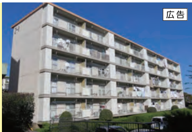
小田急小田原線「東海大学前」バス7分 徒歩2～10分