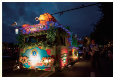
祭りを彩るフロート車

祭りのファイナーレを飾る打ち上げ花火の募金を、銀行振り込みと募金箱で受け付けています。たばこ祭は皆さまからの協賛金で運営しています。皆さまのご支援をお願いします。