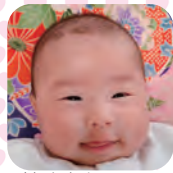
まさいしちほ 牧石千穂ちゃん (4・1・6生 堀川)