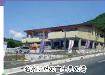
名水はだの富士見の湯