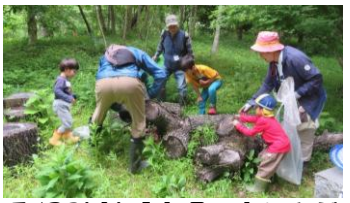
5/23(土)「広場で虫をさがそう」(15人)

参加者の声 ・ホタルは山奥に行かないと見られないイメージでしたが、秦野で見られてびっくり。色々な虫に触って体験したことは大きな経験と感じました。