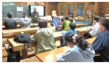
5/21(木)、22(金)「ほたるの観察会」(59人)