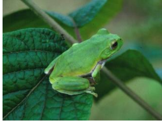
シュレーゲルアオガエル