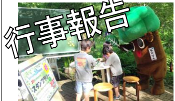
5/3(日)〜6(水) もいん登場 30周年記念「30本の木をめぐるスタンプラリー」(241人)

参加者の声 ・ホタルは山奥に行かないと見られないイメージでしたが、秦野で見られてびっくり。色々な虫に触って体験したことは大きな経験と感じました。