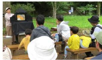
5/3(日)「かみしばいはじまるよ！」(18人)